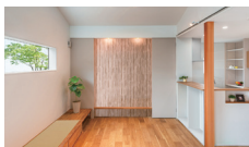
街中のサンクチュアリ