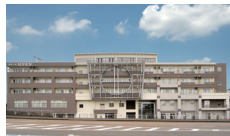
健康の駅ながおか