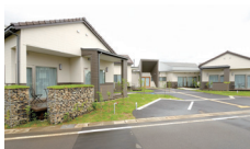
サポートセンター摂田屋