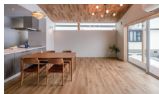
Gray to piano