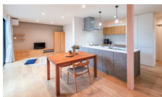
継承と新化のくらし