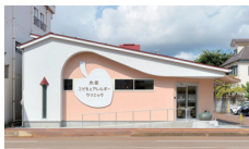
太田子どもとアレルギークリニック