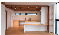
Our Own Taste