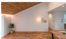
さんかく屋根の家