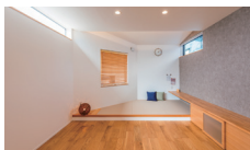
カッティングペイカー