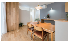
サンカク町の休日