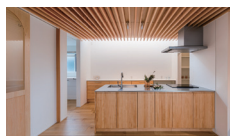
光そそぐ、ふたつの暮らし